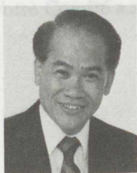
Rey Pagtakhan, Libéral Vice-président Winnipeg-Nord (Manitoba)