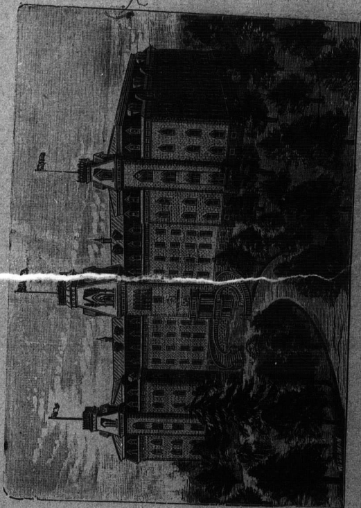
ST. LAURENT COLLEGE.