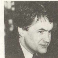
Russell MacLellan Libéral Cape Breton-The Sydneys (Nouvelle-Écosse)