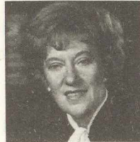
L'honorable Flora MacDonald, c.p. Conservateur Kingston-Les Îles