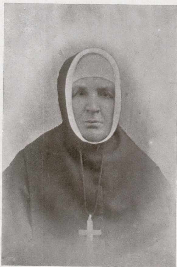
LA MÈRE CARON