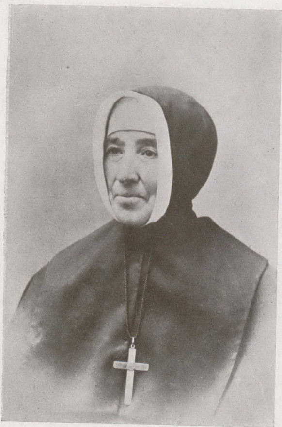
LA MÈRE MARIE DES SEPT DOULEURS