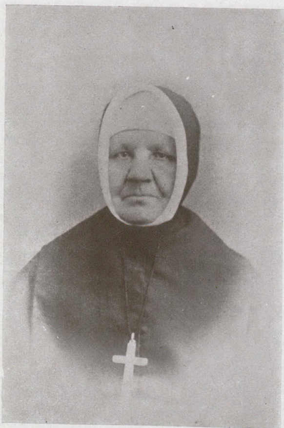
LA MÈRE ZOTIQUE