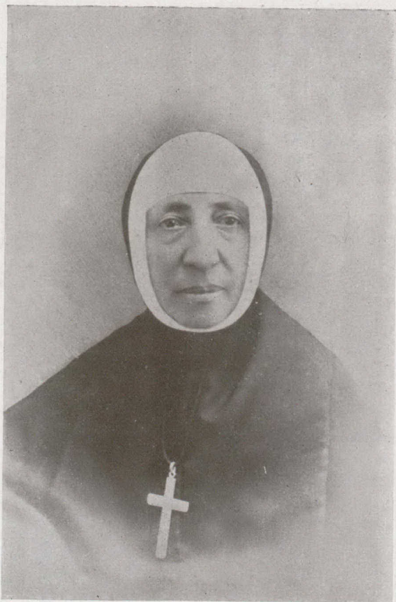
LA MÈRE DE L'IMMACULÉE CONCEPTION