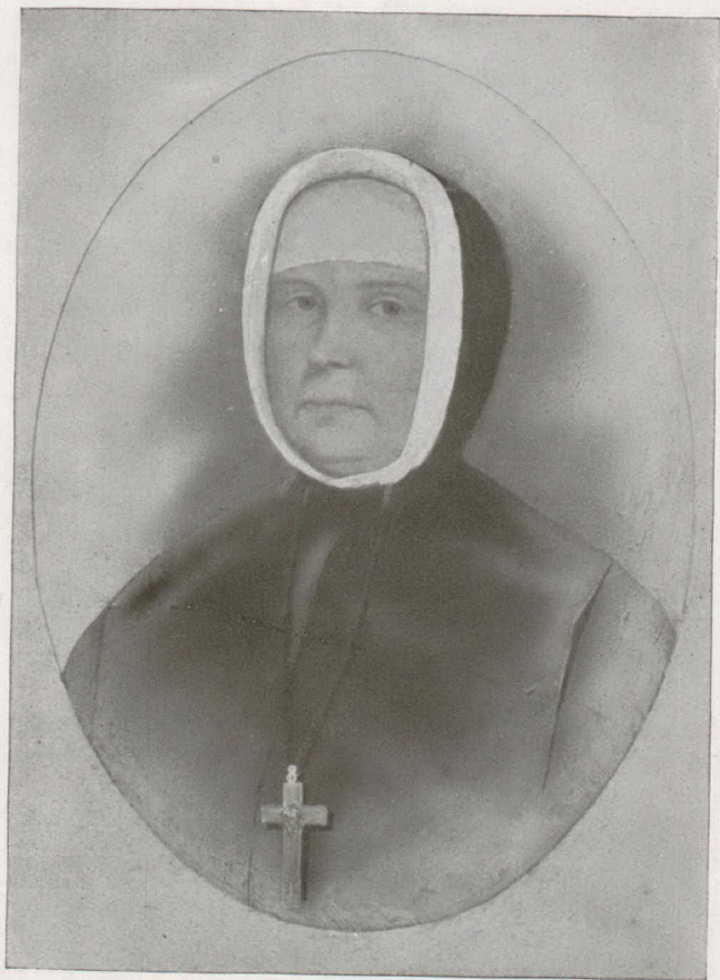
LA MÈRE GAMELIN