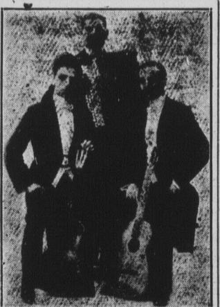
VENETIAN SERENADERS AT CHAUTAUQUA.

Les Pilules Rouges sont en vente chez tous les marchands de remèdes. Nous les envoyons aussi par la poste, au Canada et aux Etats-Unis, sur réception du prix, 50c une boîte, $2.50 six boîtes.