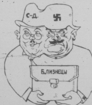
Соціал-нацизм і фашизм — дві організації буржуазії, які не відкадають, а доповнюють одна другу — це не антиподи, а близнюки! (З промови Сталіна)

Завтра має зібратися в Відні конгрес II Інтернаціоналу. 10 років тому в тому самому Відні вперше зібрався герой 2½ інтернаціоналу, паче Кавтський Отто Бауер, Гільфердинг, Мекс-Доналд та інші, щоб відбудувати Інтернаціонал, що розвалився у вогні світової війни. Може цей вогні став приводом до того, щоб IV конгрес відновленого II інтернаціоналу, де тепер Отто Бауер, Гільфердинг і Ко, мирно та приязно сидять разом із воєнними та кайзерівськими соціалістами Вандервельде, Гендерсоном, Томасом, Вельсом, Блюмом і Ко, відбувся саме в Відні.