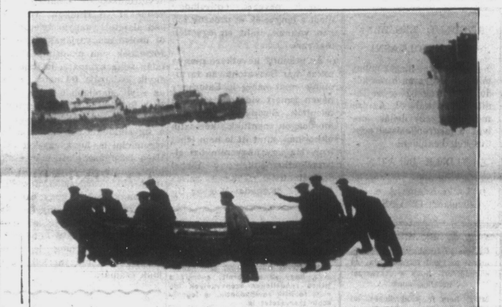
A Newfoundland melletti Horse sziget közelében felrobant „Viking” nevű fókavadászhajót és a megmenekültek egy részét mutatjuk be képeinken. Alul a Southam Press Syndicate egyik drámai erejű felvétele látható, mely a sebesülteknek a mentőhajókra való szállítását ábrázolja. Az örökre eltűnt áldozatok számát 28-ra becsülik.

szemben követeltek s a magyar kisebbségre sokkal keményebb sorsot mértek, mint amilyenben a rumánoknak Magyar országban valaha is részük volt.