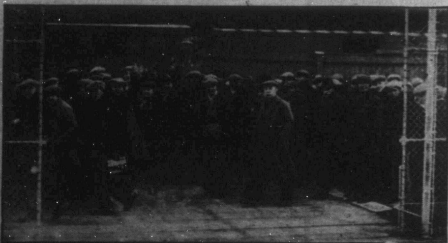
Munkára fel! Nyolcezer kanadai család felett derült ki az égből, amikor a Canadian Pacific 8,000 munkását alkalmazta újra a múlt hét folyamán. Bár a vasutakat is erősen próbára tevő válság következtében havonként csupán 16 napot fognak dolgozni a CPR műhelyek szakemberei, ezáltal Montrealtól Calgariig mintegy 30,000 embernek biztosították téli megélhetését.