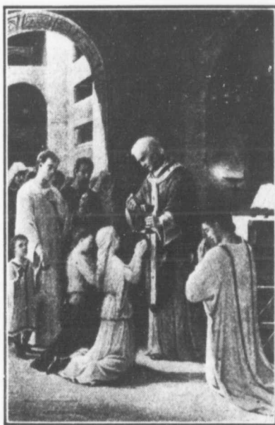
La Communion aux Catacumbes

La communion du prêtre terminée, le diacre fait entendre cette parole solennelle : Sancta sanctis! A ce signal, les communiants, la tête humblement baissée, les mains jointes, s'avancent vers l'autel ; sur leurs mains étendues, ou sur un linge nommé " dominical "