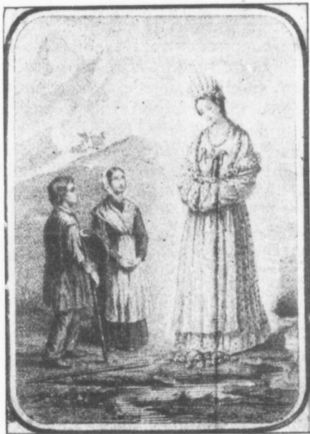
Notre-Dame de la Salette.