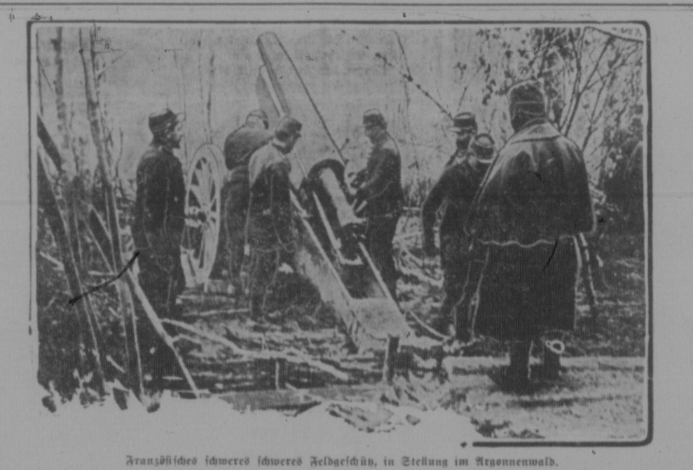
Fransösisches schweres schweres Feldgeschütz, in Stellung im Argonnenwald.

„Ja“, sagte ich, „die Vögel sind es. Sie meinen das Futter.“ Und schon von uns aufgeschreckt, flog hier und da einer und seinen federichten Körper auf. Und dann erbeugten wir einen Feind, den ich nicht kannte. Er war klein, aber sehr schnell, und er flog über uns hinweg, ohne uns zu berühren. Ich dachte, er wäre ein Adler, aber er war viel kleiner. Er flog über uns hinweg, ohne uns zu berühren. Ich dachte, er wäre ein Adler, aber er war viel kleiner. Er flog über uns hinweg, ohne uns zu berühren. Ich dachte, er wäre ein Adler, aber er war viel kleiner.