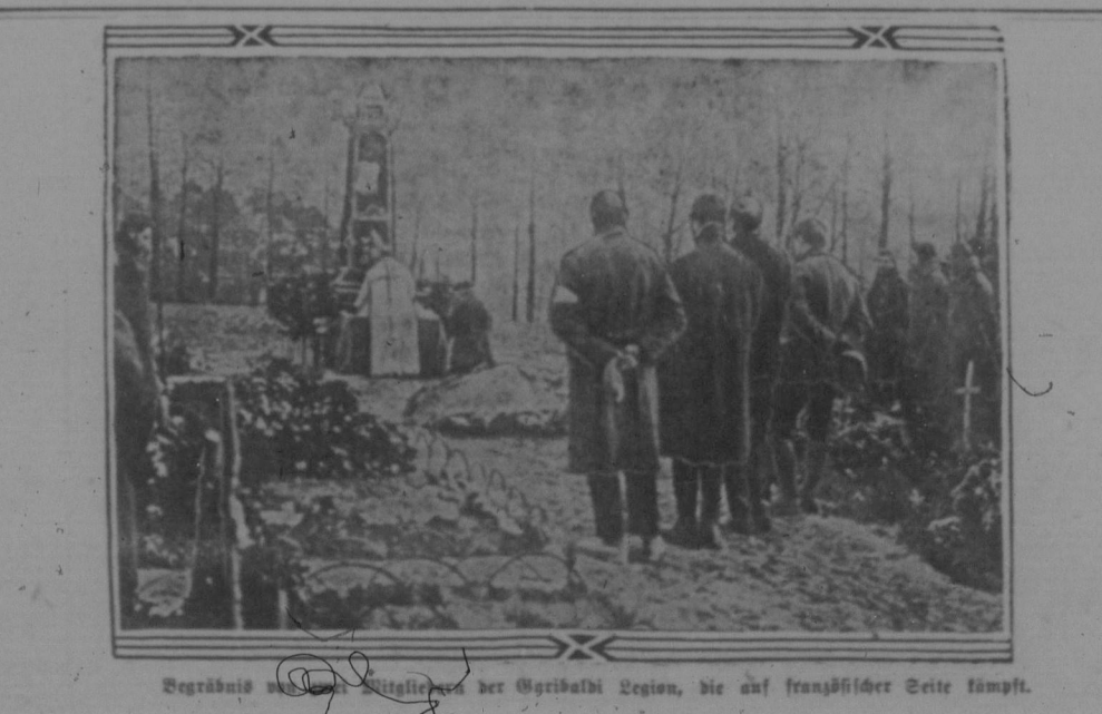
Begräbnis von Soldaten der Gibraltari Region, die auf französischer Seite kämpften.