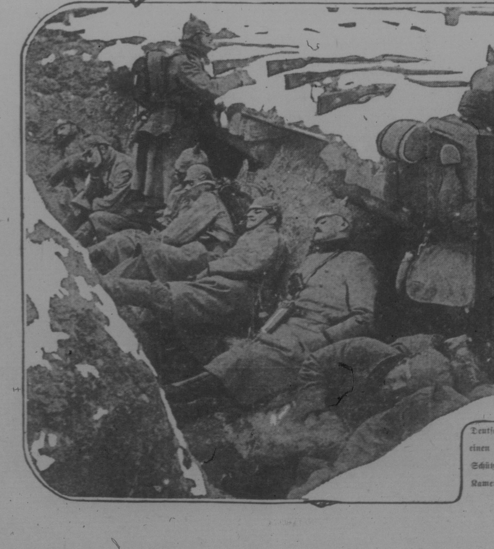
Deutsche Soldaten nach langen Kämpfen einen kurzen Rasttag in den Schützengräben haltend, während einige Kameraden die 'Wacht' übernommen haben.

„Auf den Höhen von Craonne, südlich von Laon, trugen sich Kämpfe zu, die für unsere Truppen von Erfolg begleitet waren.“