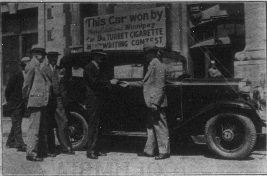
80 centért egy vadonuj autót kapott a CPR Weston javítóműhelyének egy előmunkása a Turret cigarettagyár sorsolásán. Immár két hónap óta hetenként rendez ilyen sorsolást a Turret cigarettát előállító Imperial Tobacco Co. és négy csomag 20 centes cigarettát szomogolópapírjára irt legérdekesebb aláírás beküldőjének egy, az ontariói Oshawa városában készült új "Chevrolet" gyártmányú kocsit ajándékoz. Képünk azt a jelenetet mutatja, amint a boldog tulajdonos átveszi a pazar kiállítású gépkocsit.