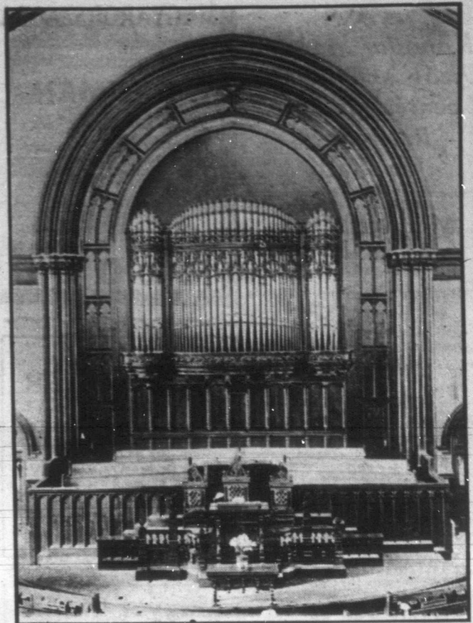
A quebeci Casavant-cég egyik legújabb gyártmányú orgonája, melyet a messze Ausztráliába készítettek rendelésre a világhírű francia-kanadai orgona-készítők.