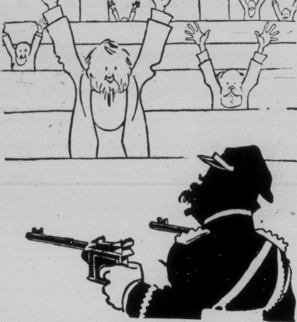
Хто за урядом Пілсудського — руки вверх!

ТАК ПОЛЬСЬКИЙ СОІМ ГОЛОСУЄ ЗА ВИСЛОВИМ ДОВІР'Я УРЯДОВІ ПІЛСУДСЬКОГО.