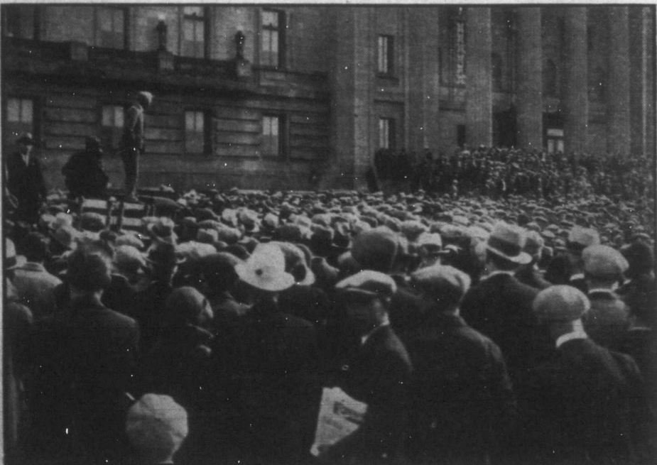
Winnipegben az elmúlt héten több mint ötezer főnyi tömeg tüntetett az új kétszázalékos kereseti adó ellen, mely igen érzékenyen érinti Manitobának összes munkában lévő polgárát.