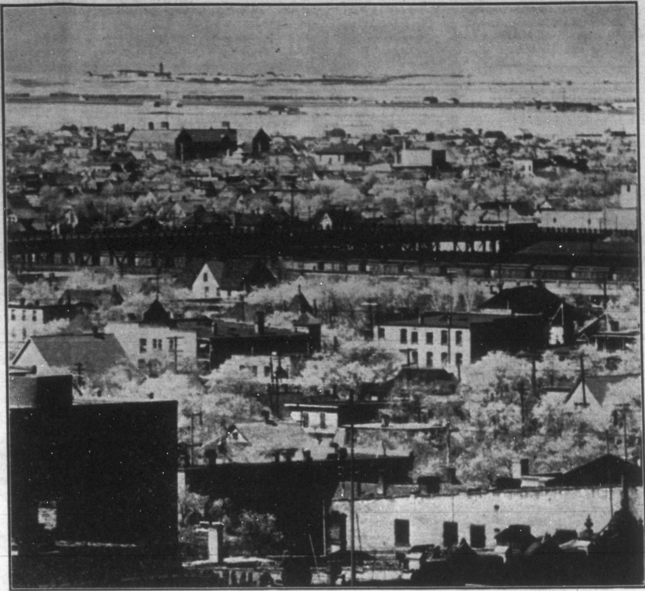
A fényképezési technikának csodálatos fejlettségéről tesz tanúságot a fenti kép. Winnipeg egyik legmagasabb épületéről a Mc-Arthur Buildingről 166 lábnyi magasságból készült felvétel világosan mutatja a várostól 13 mérföldnyire lévő Stony Mountain fegyház körvonalait, melyet még a legtisztább időben is csak elvétve lehet szabad szemmel látni. Ennél a felvételnél három erősségű lencsét és az u.n. "Infra red" vörös sugarakat használták, melyek képesek áthatolni a levegő párján és olyan távolságra "látják" meg a tárgyakat, melyre az emberi szem nem elég erős.

AZ OLASZ Villanova város- ban a napokban levágtak egy ökröt, melynek súlya elérte a