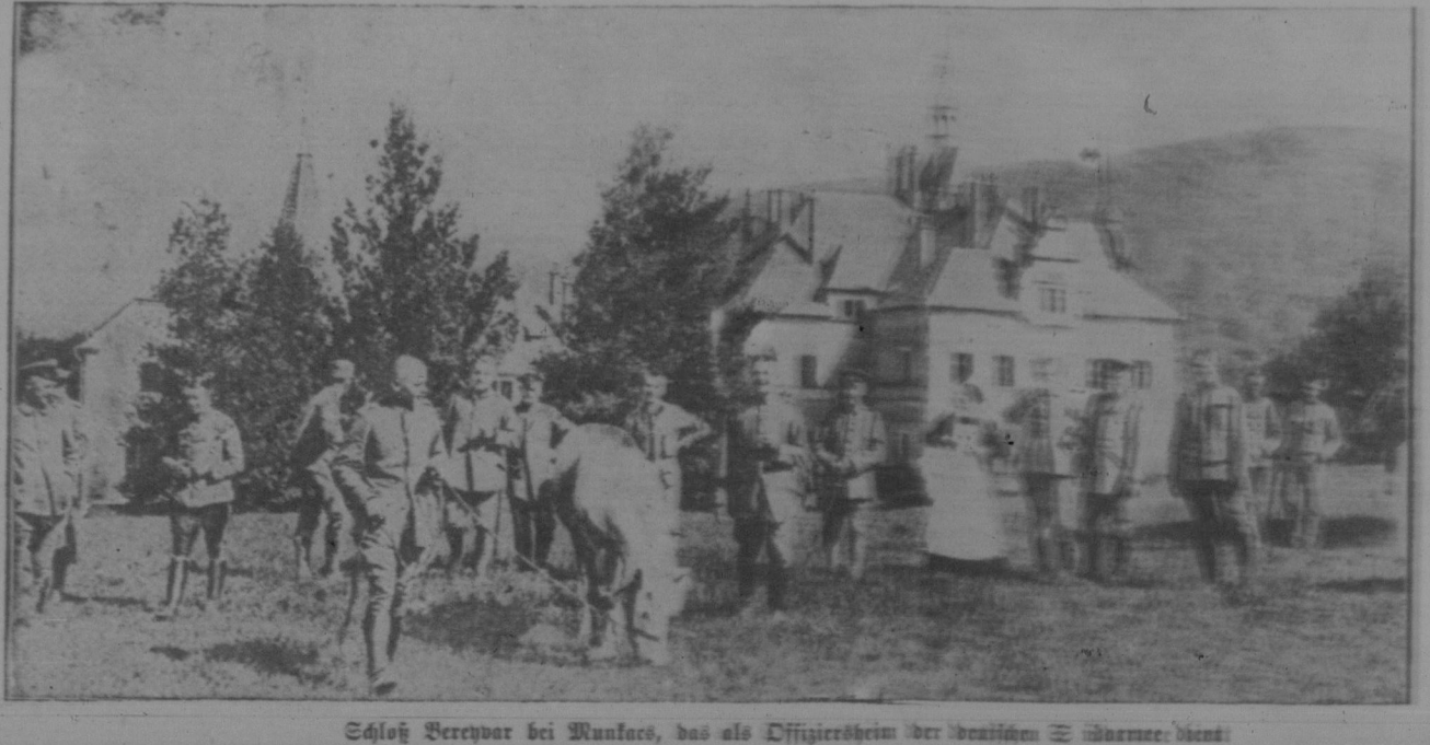
Schloß Berchpore bei Runkles, das als Offiziersheim der deutschen 3. Armee dient.