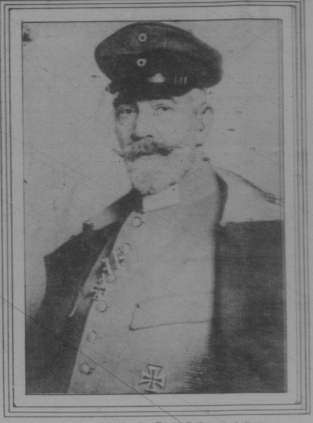
Der deutsche Reichsminister Dr. v. Bethmann-Hollweg.