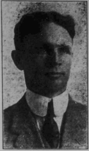
PROF. JOHN BRACKEN Manitobas blivande premiärminister.

progressivt parlamentets medlem för Springfield. Mr Bracken har fått full frihet att själv välja medlemmarna i sitt kabinet. Vice guvernören kommer officiellt att underrättas om detta val och så snart denna ger Mr Bracken i uppdrag att bilda ny regering är han redo att så göra. Premiärminister Norris har meddelat, att han är villig bära bordan tills den nya regeringen är redo tråda in, vilket nog kommer att taga cirka en månad.