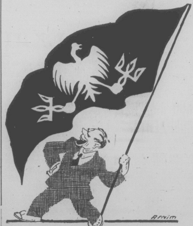
Волинський воевода Юзефський, вибирається на Україну під польсько-шляхетським-петлюрівським прапором. Давно вже вибирається, але ані кроку ще вперед не ступив поза своє воевядство.