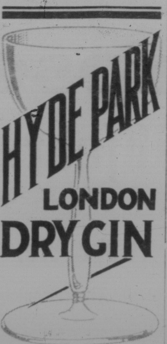
Die einzige Grundlage eines perfekten "Cocktail"

Die Voraussetzungen zu diesem Aufstiege sind in kultureller Hinsicht vorhanden. Auch darüber gibt uns das Jahresbuch ermunternde Aufschlüsse. Das Deutschtum in Lettland verfügt über 12 Zeitungen in Riga und Libau und je eine Zeitung in Mitau und Windau, wie über 11 Zeitdrucken, die in Riga erscheinen. An Büchern erschienen im Jahre 1924 allein 67, von denen die Hälfte wissenschaftliche Werke waren. Dabei steht das deutsche Schulwesen im Vordergrund. Der gegenwärtige Stand der deutschen Schulen in Lettland ist bereits auf einer besonderen Seite des Jahresbuches eingehend behandelt. Die Sorge um die kulturelle Weiterbildung für die heimische Bevölkerung deutscher Herkunft ist ein Anliegen der lettischen Kulturbehörde, die in der Organisation der deutschen Schulen in Lettland die besten Kräfte zu sammeln sucht. In der Organisation der deutschen Schulen in Lettland ist die deutsche Kulturbehörde, die in der Organisation der deutschen Schulen in Lettland die besten Kräfte zu sammeln sucht.