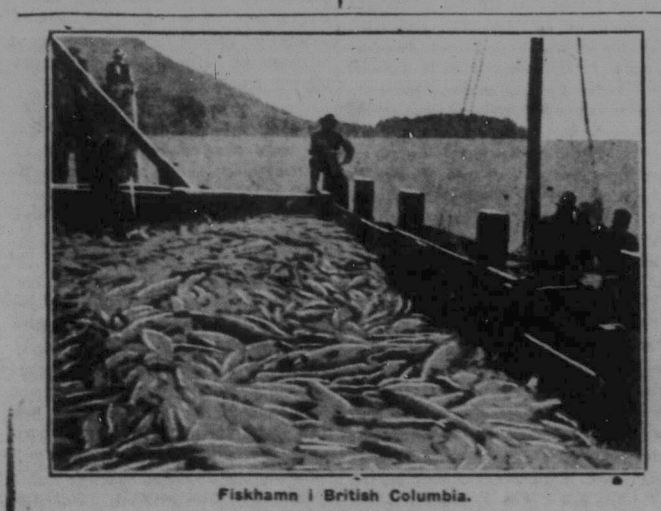
Fiskhamn i British Columbia.