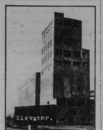
Elevator i Prince Rupert, B. C.