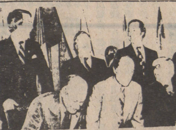
(中)保長金省高愛(左)安省長省曼排後 (左)域長省省古排前(右)納省長省詩卑 (右)澤省長省納安(中)相省省陶

陶杜要將人權列為憲法內一章，但遭到各省省長強烈反對，五位東省省長與李域聯合反對，加西四省同時反對陶杜之英法語文保障提案，而九省亦反對卑詩省省長納主張全加重劃五大區之議。昨會議爭論一天，毫無結果。