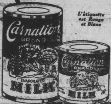
L'étiquette est rouge et blanc

Produit en Canada par la CARNATION MILK PRODUCTS CO., LIMITED —Aylmer—Osterville—1177