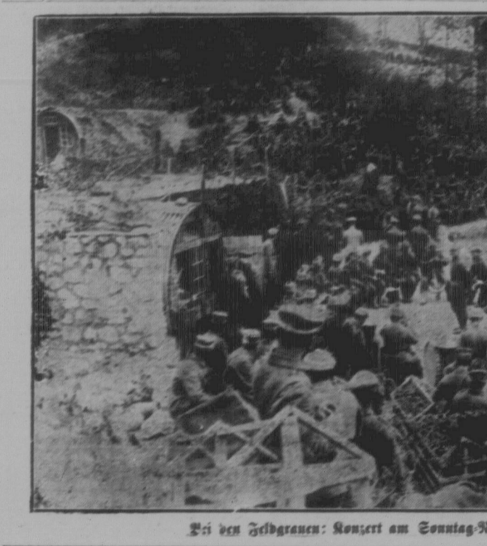
Bei den Feldgraben: Konzert am Sonntag-Nachmittag.