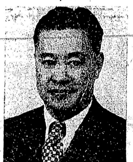
人証公兼官保地留祖留