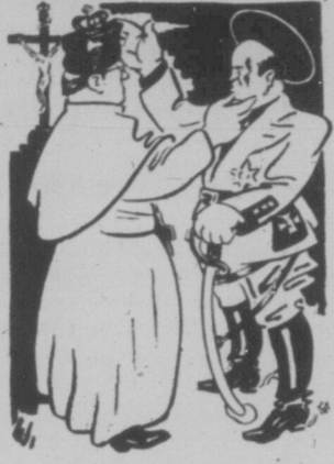
Папа римський і Муссоліні помирися.

Місяців три тому назад почалася була гостра драчка між Муссоліні з римським папою. Папа римський дїставши власну державу, заснував "католицьку акцію", політичну організацію, яку наказав католицьким організаціям по цілому світі. (В Галичині філією цієї організації є "Український Католицький Союз".)