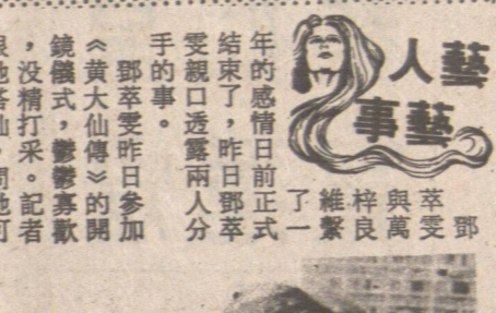
已受萃鄧候時的始開情投這