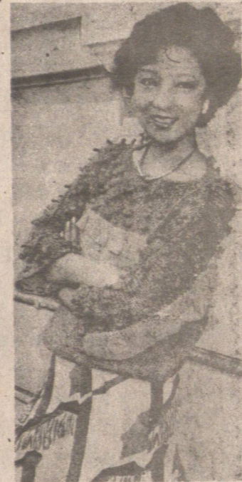
恬妮說，女兒太胖了，多別神。