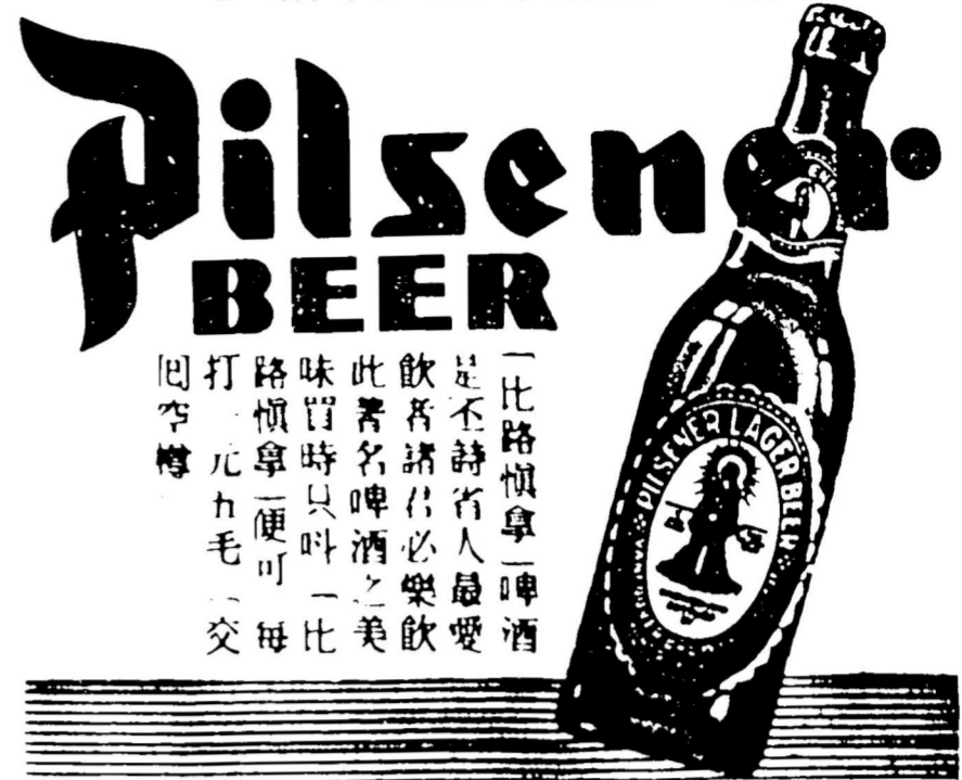
This advertisement is not published or displayed by the Liquor Control Board or by the Government of British Columbia.