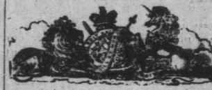
Synopsis of Canadian North-West Land Regulations

Nous avons suivi pendant plusieurs années un cheval qui faisait un service très actif, et qui portait à chacun des coudes une callosité de ce genre atteignant les dimensions de la tête d'un homme. En général l'éponge (crapaud), est plutôt gênante, disgracieuse, que nuisible. Pourtant elle peut devenir sensible au point de nécessiter la suspension du travail. Dès qu'on aperçoit une excoriation, un frottement, à la surface de la région, il importe de surveiller la manière que le cheval se couche. Si ce dernier se couche en vache il y a indication d'y remédier soit en enveloppant le pied, soit de préférence, en faisant raccourcir la branche interne du fer pour l'empêcher de porter contre le coude. (Reproduit de Goubaux & Barrier.)