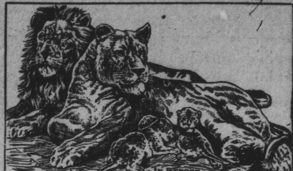
THE KING OF BEASTS AND HIS FAMILY. THE 3 BABIES BORN IN THE ABOVE PICTURE IS A BARELY SCENE WITH THIS SHOW.