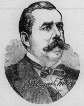
Première Tournée de 1886.

HEURES DE CONSULTATION: Tous les jours depuis 8 hrs. du matin jusqu'à 8 30 hrs. du soir. (Dimanche excepté.) Consultations et avis concernant toutes les maladies et infirmités données GRATUITS.