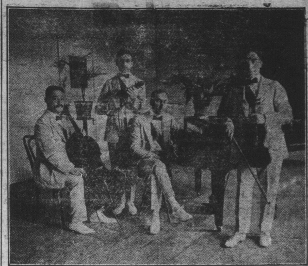
RUSSIAN STRING QUARTET.