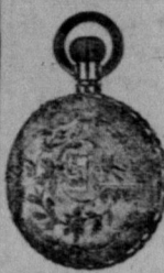
billigare än andra priser parti.