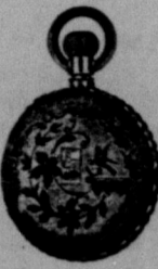
billigare än andra priser parti.

insätas i ramar billigt och omorg-fullt af A. F. WATERS, 2784 MAIN ST. Midt emot Manitoba hotell.