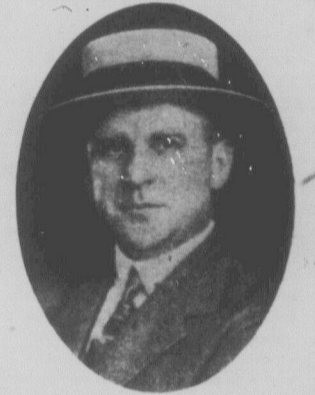
Фулер, мільонер-губернатор штату Массачусетс, який відмовився стримати вбивство Сакка й Ванзеті.