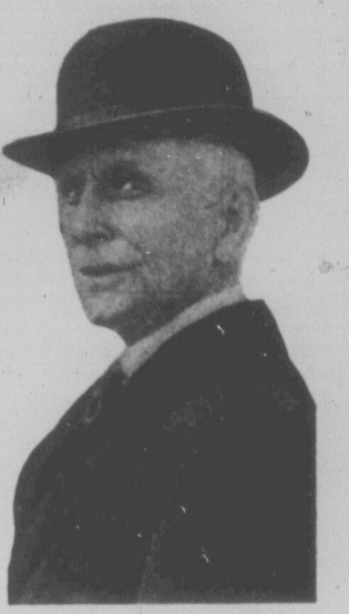
Суддя Теер, який засудив на смерть невинних Сакка й Ванзеті.