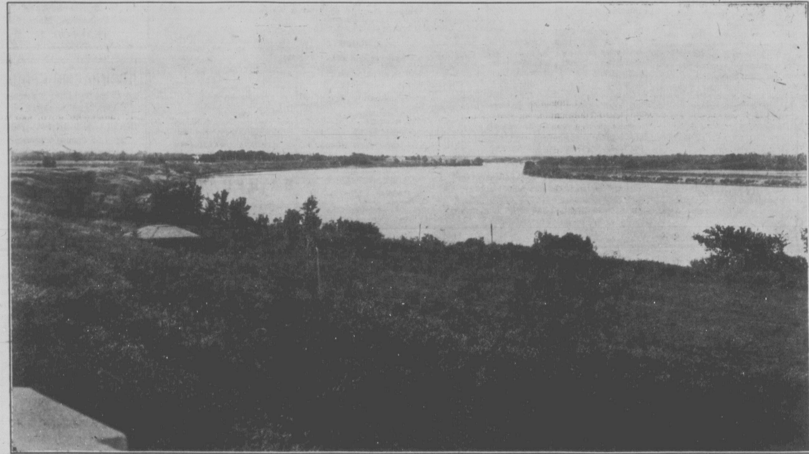
ВІД З ТЕРАСИ НОВОКУПЛЕНОГО БУДИНКУ-ПРИЮТУ Р.З.Т. НА ЧЕРВОНУ РІКУ І ОКОЛИЦЮ В ПІВНІЧНОМУ НАПРЯМІ. ПЕРШІ ПУБЛІЧНІ ОГЛЯДИНИ БУДИНКІВ І ПІКНІК НА ЦІЙ ФАРМІ ВІДБУДУТЬСЯ В НЕДІЛЮ, 26 СЕРПНЯ 1928 РОКУ. НА ПІКНІКУ ГРАТИМЕ ДУТА ОРХЕСТРА, ПРОМОВЛЯТИМУТЬ ПРОМОВЦІ І ПРИЙМАТИМУТЬСЯ ЧЛЕНІВ ДО Р.З.Т.