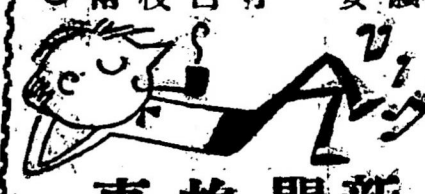
新 聞 故 事