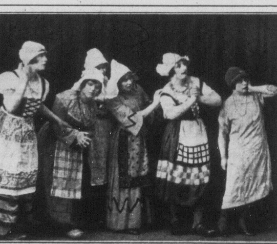
Жінки голандських рибаків, підчас страшної бурі на морю, чекають на своїх чоловіків, що виїхали на ловлю оселедців. Сцена представляє жах жінок, які тільки що довідалися загинути своїх чоловіків в морі.

Жінки голандських рибаків, підчас страшної бурі на морю, чекають на своїх чоловіків, що виїхали на ловлю оселедців.