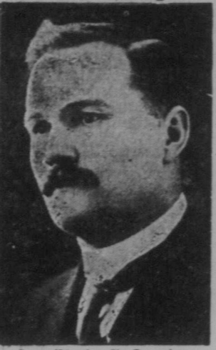
Herr Charles A. Dunning

Nach einer Mitteilung der liberalen Parteileitung wird Finanzminister Charles A. Dunning am Donnerstag in Regina erwartet, wie ein telegraphisches Mitteilungs aus Ottawa besagt. Es ist bestimmt zu erwarten, daß Dunning wieder zum Kandidaten für den Bundeswahlkreis Regina ernannt wird. Die Nominierung wird nächsten Montag, den 16. Juni, abends 8 Uhr, in den Armoures zu Regina stattfinden. Die Liberalen aus der Stadt Regina wie aus den ländlichen Teilen dieses Wahlkreises mögen sich in Wallen zur Nominierungskonvention einfinden.