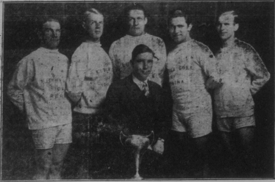
Das Luther College, „Trak Team“.