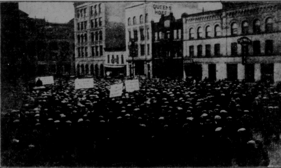
Повища картина представляє масовий мітинг безробітних у Вінніпегу в "Червоної Четвер" незадовго перед тим, як поліція брутально напала на безробітних і помію кількарізних спроб робітників улаштувати похід — розбила демонстрацію. Написи, що їх видно на картині, звучали: "Домагаємося праці або платні", "Безплатна асеруація безробітних", "Безробітні парадуйте — всі безробітні ставайте в ряді", "Домагаємося праці або повного утримання".