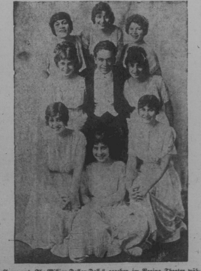
Szene aus 'The Million Dollar Doll', gegeben im Regina Theater während der ersten drei Tage in dieser Woche.