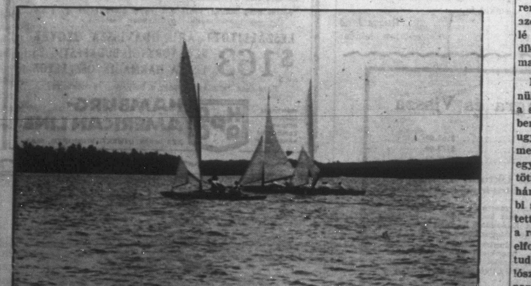
A Nagy Tavak beláthatatlan vizen éppen úgy, mint a nyugatontariói "Ezer tó országa" tenger-szeméin egyaránt otthonos a viharos-csónak, melynek a mai világban az ad különösebb vonzódást, hogy nem kell a meghajtásához — gázolín. Fenti képünkön két versenyző vitorlást mutatunk be a "Winnipeg Tribune" szíveségből.