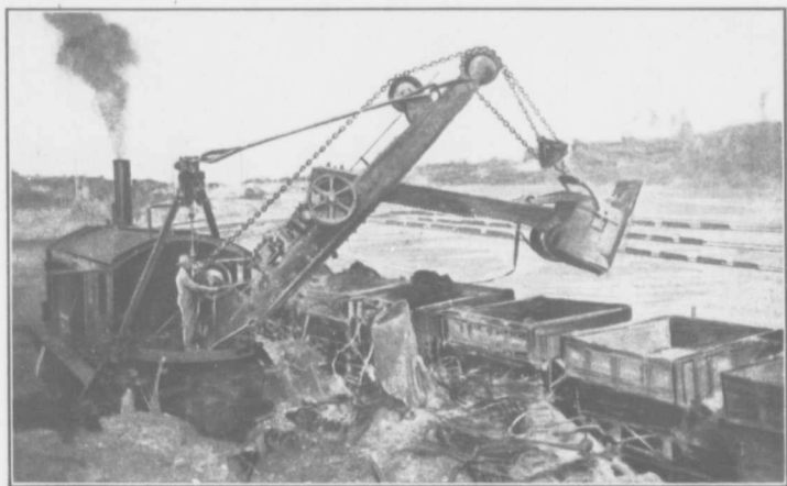
LES COURS A FRET —Photographie des cours à fret et du site des Usines du Grand Tronc Pacifique en face de Pontville .

Pontville —La seule propriété en face du Pont de Québec