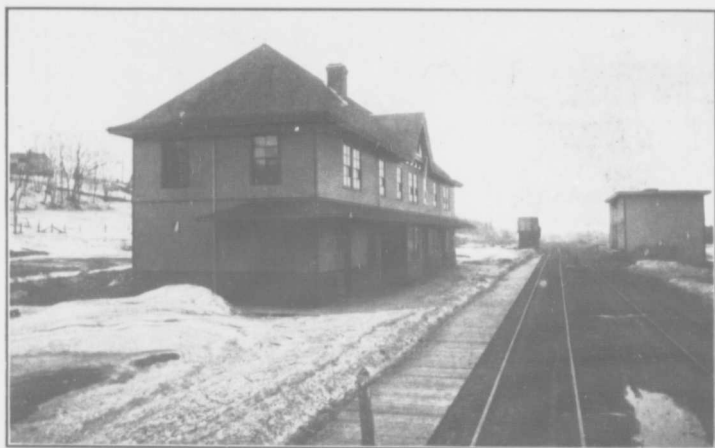
LA GARE AU PONT DE QUEBEC —Photographie de la gare du Grand Tronc Pacifique, au Pont de Québec, exactement en face et à quelques pieds de Pontville .