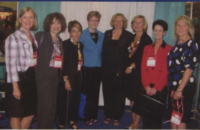
The Canadian delegation at the 2010 WBENC National Conference in Baltimore.