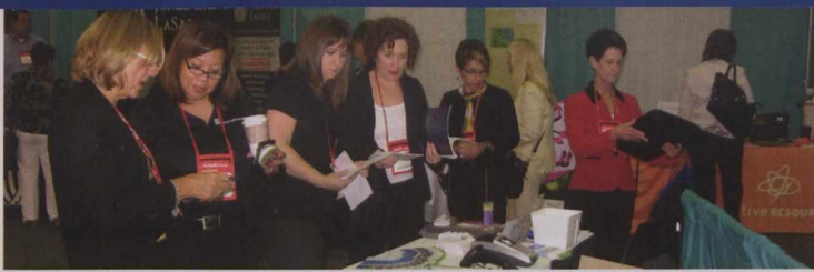
Des propriétaires d'entreprises canadiennes qui se sont jointes à la mission commerciale à l'intention des femmes participent à la conférence nationale du WBENC, à Baltimore.