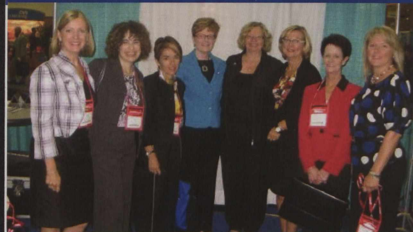
La délégation canadienne à la conférence nationale du WBENC, à Baltimore.