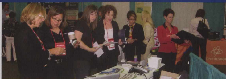
Canadian business owners participate in the 2010 women's trade mission to the WBENC National Conference in Baltimore.