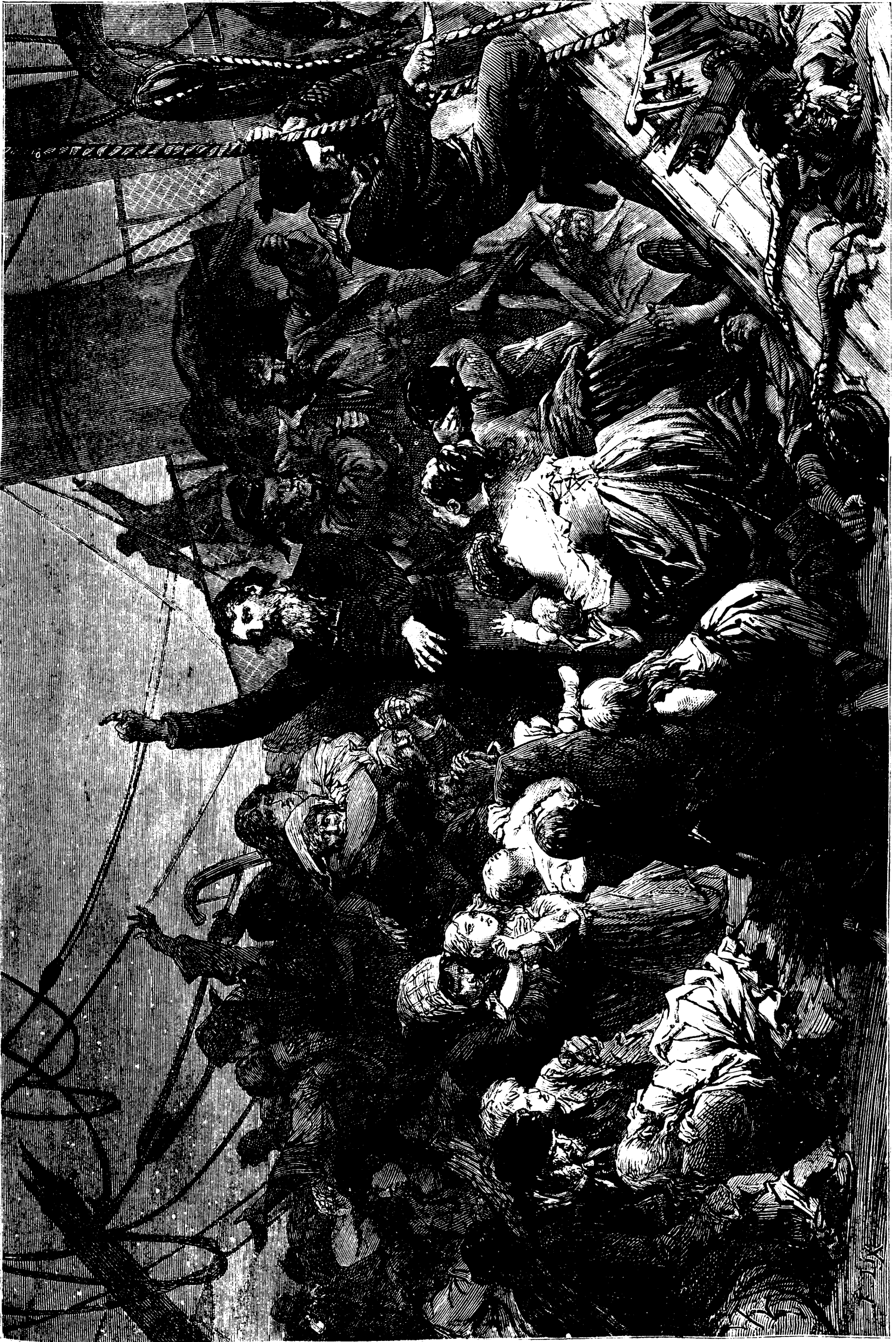
NAUFRAGE DE « LA VILLE DU HAVRE. — LE PRÊTRE DONNANT L'ABSOLUTION AU MOMENT SUPRÊME.