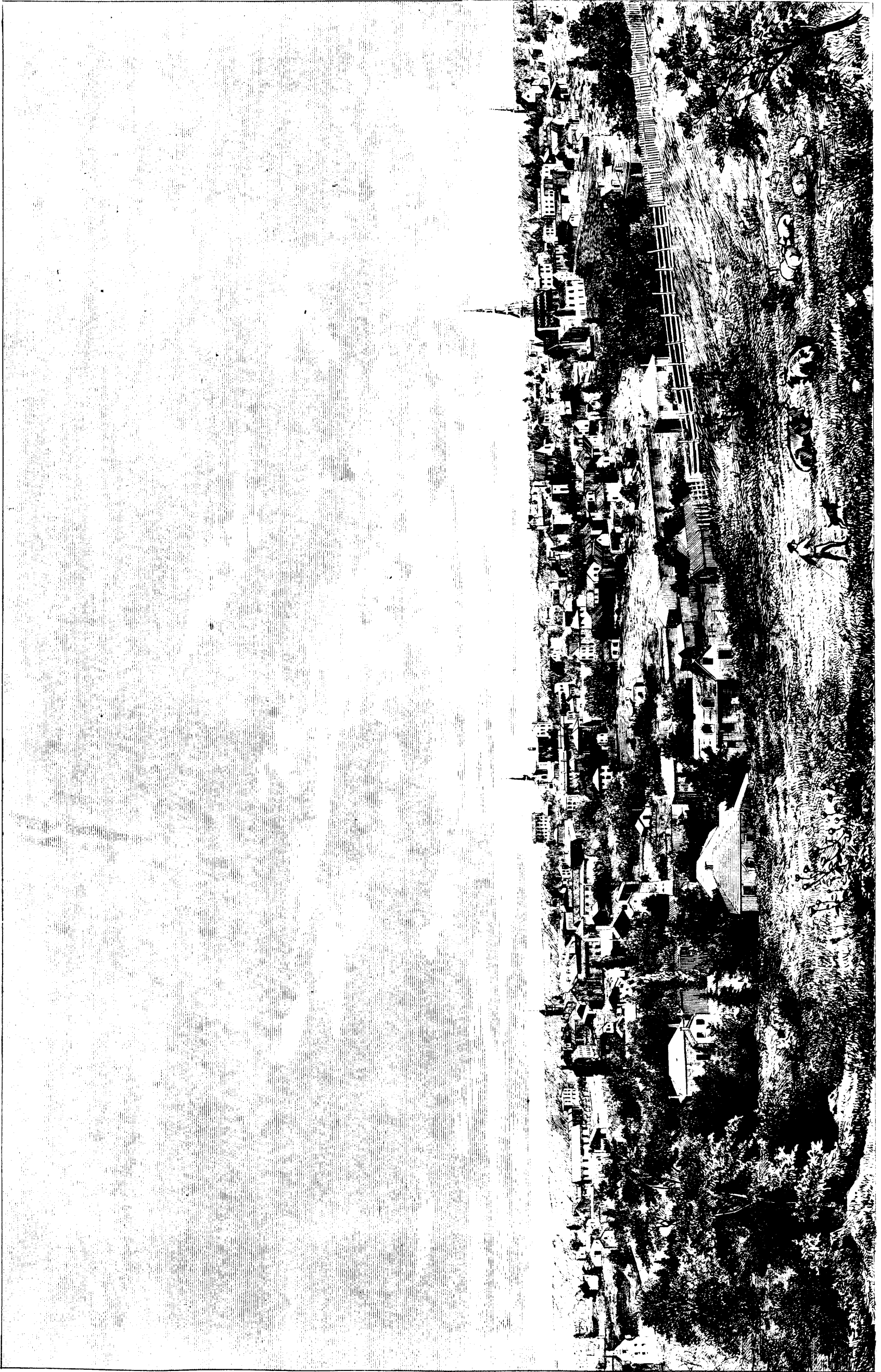
LA VILLE DE GUELPH, ONTARIO.