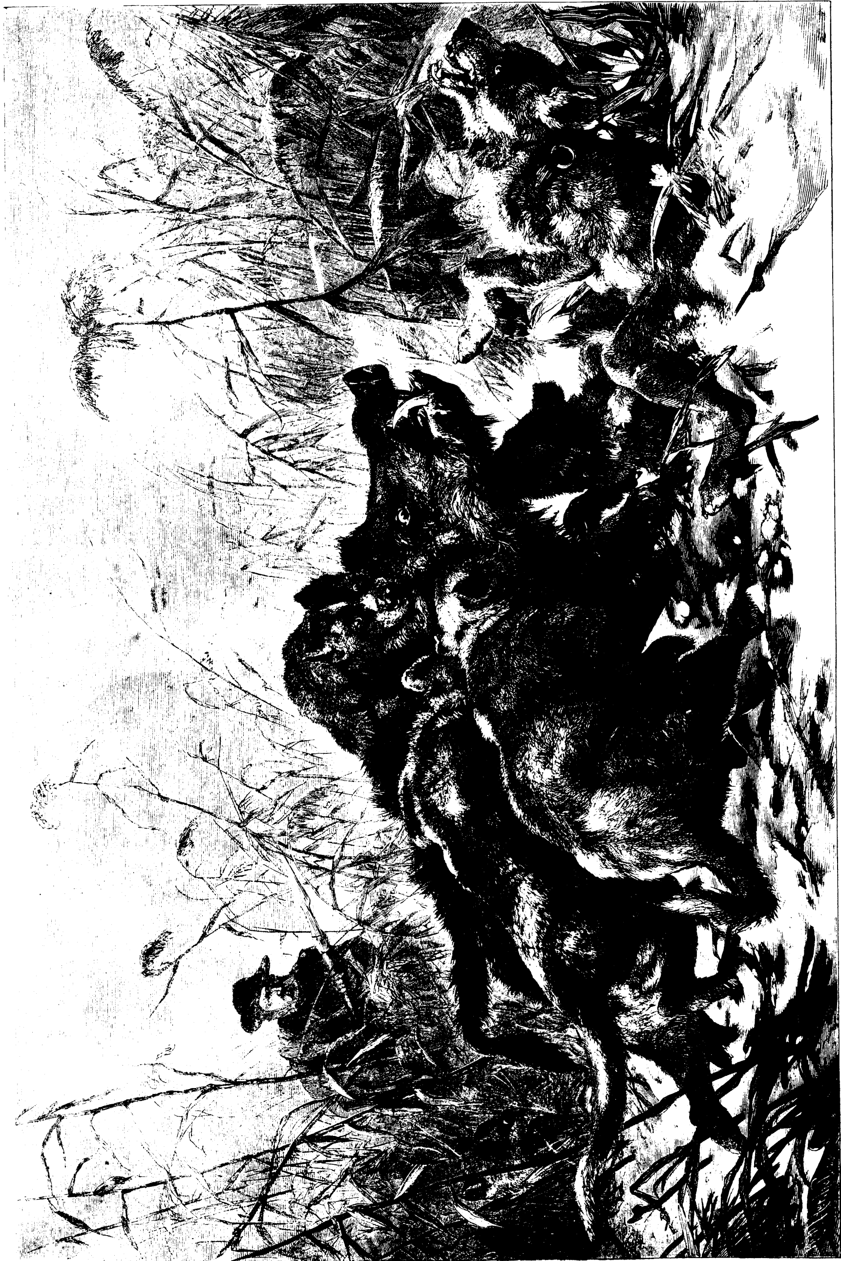
LA CHASSE AU SANGLIER.