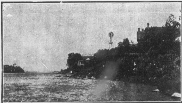
Un des points de la rivière Des Prairies vers lequel le découvreur remonta, en 1610, jusqu'en face du bas du Sault.

Quand vos enfants vous demanderont, dit-il, ce que signifient ces pierres vous pourrez leur répondre qu'elles rappellent une action honorable, ou encore, le souvenir d'un bienfait du Seigneur.