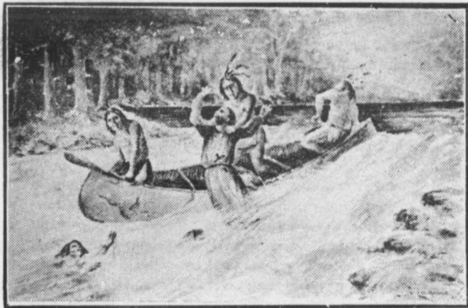
Le Père Nicolas Viel, précipité dans le dernier saut, avec son néophyte Ahuntsic, en face du village du Sault-au-Récollet.

Quand les étrangers et les touristes visitent la paroisse du Sault-au-Récollet et qu'ils passent en vue des cascades au bout de l'Île de la Visitation, (1) nous les invitons à jeter un regard sur le point le plus élevé de cette île pour y évoquer le souvenir d'un saint mission-