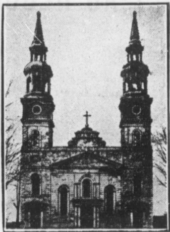
L'église du SAULT-AU-RÉCOLLET, sur le parcours de la rivière Des Prairies.