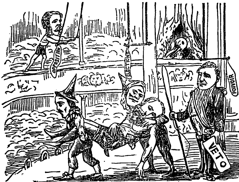
AU THEATRE DE QUEBEC.—Saut périlleux.—Leap for Life

On a bu un grand nombre de santés. Pour la santé du bon Luc,