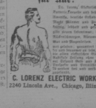
C. LORENZ ELECTRIC WORKS, 2240 Lincoln Ave., Chicago, Illinois

Der Courier... Organ der Deutsch-Canadischen... Extrablatt