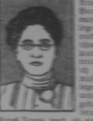
Portrait of a woman mentioned in the article.