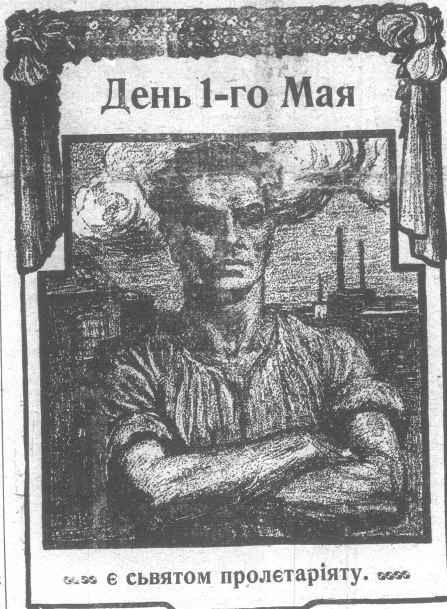
... є св'ятком пролетаріяту.

для всіх робітників, без різниці де вони не працювали. Працюючи тільки 8 годин на день, будем сильніши чим тепер і вечером по повороті з роботи не будемо як тепер змучені будем мали час навчити ся де чого, забавитесь і подумата, о собі.