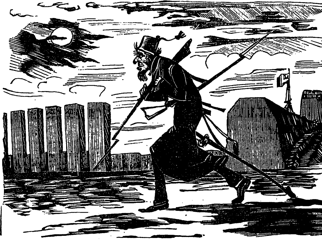
LE BIMANE CROKNUFF MONTE SA GARDE.

M. Croknuff avait à peine terminé sa lecture que de violentes détonations retentirent au bout de l'avenue, c'était une batterie d'artillerie qui tentait de protéger la retraite et d'arrêter les assaillants.