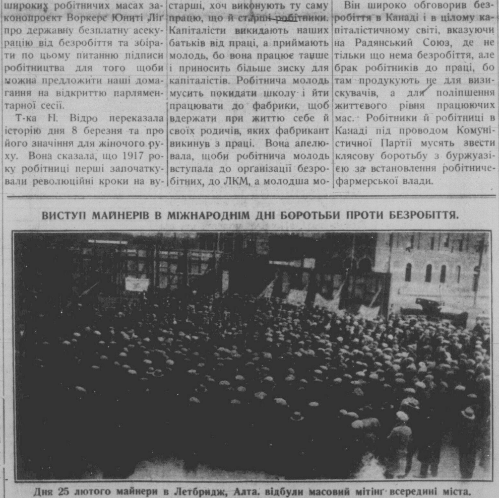
Дня 25 лютого майнери в Летбридж, Алта. відбули масовий мітинг всередині міста.