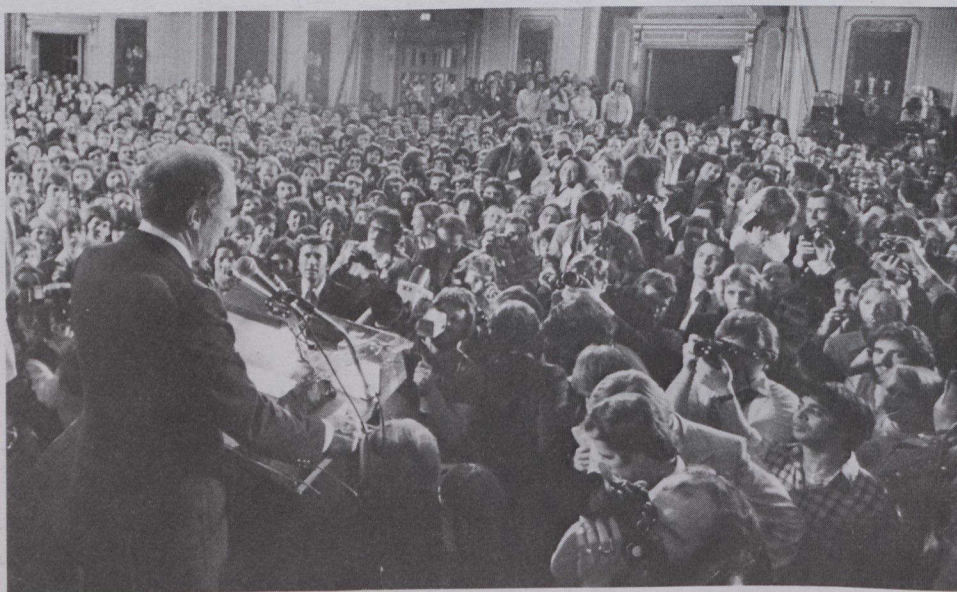
Bienvenidos al decenio, dijo el Primer Ministro Trudeau a sus simpatizantes.

Al hablar sobre Quebec, el Sr. Trudeau manifestó: "la provincia de Quebec, en particular, tiene entendido por mucho tiempo que uno puede ser ciudadano de Canadá, ser orgulloso de pertenecer a una provincia, pero ante todo estar orgulloso del país en sí mismo, del total de Canadá."