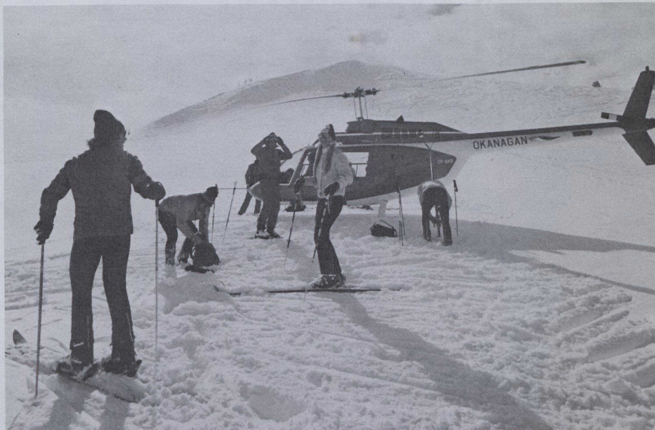
Canadian Government Office of Tourism

El ir a esquiar con helicóptero es otra fase de la libertad de elegir la pendiente adecuada y las mejores condiciones de la nieve de entre seis montañas seleccionadas en la Colombia Británica.