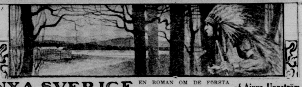
NYA SVERIGE EN ROMAN OM DE FORSTA SVENSKARNES LIV I AMERIKA af Aivva Uppström

Rinowehan och andra svensksinniga indianer smög sig trots fiendens vaksamhet ut från i fastningen med underrättelser från omgivningarna. Men de medförde blott olycksbud på olycksbud. Redan innan flottan anlände till Trefaldighetsskansen, hade holländarna vid Asamohacking, där Ellsberg legat, tillfångat några frimän.