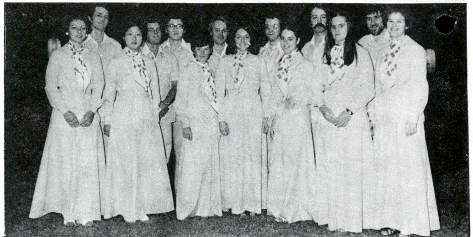
Les hôtes et les hôtesse du pavillon canadien à l'Expo '75.

La participation du Canada à l'Expo '75 est parrainée par les ministères des Affaires extérieures, de l'Environnement, de l'Industrie et du Commerce et par le ministère d'État aux Sciences et à la Technologie. L'exposition canadienne a été conçue et réalisée par Information Canada/Exposition. M. J.D. Kingham, du ministère de l'Environnement, a également apporté sa contribution.