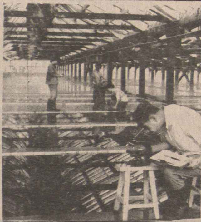
山東省水產研究所的海產品培養室是中國最大的培養室，面積五千平方米，室內建有一百多個培養池。圖為科研人員在檢查珍貴海產品幼體發育情況。

青島市位於黃海的膠州灣畔，從1977年開始發展珍貴海產品養殖。在黃海水產研究所，山東省水產研究所和青島第一海水養殖場等單位配合研究下，經過多次試驗，成功地促使珍貴海產品雌雄體同時排卵、輸精，獲得了人工培育的幼體，同時，也培育出飼養幼體藻類的餌料和配制的餌料。他們把幼體飼養成幼苗後，就向海中投放。