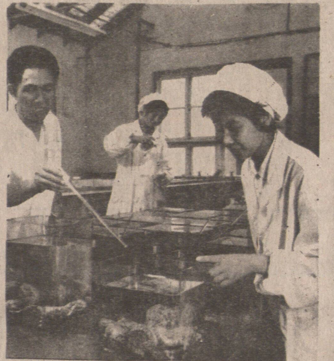
科研人員喜悅地注視着扇貝，鮑魚大量排卵輸精的情況。