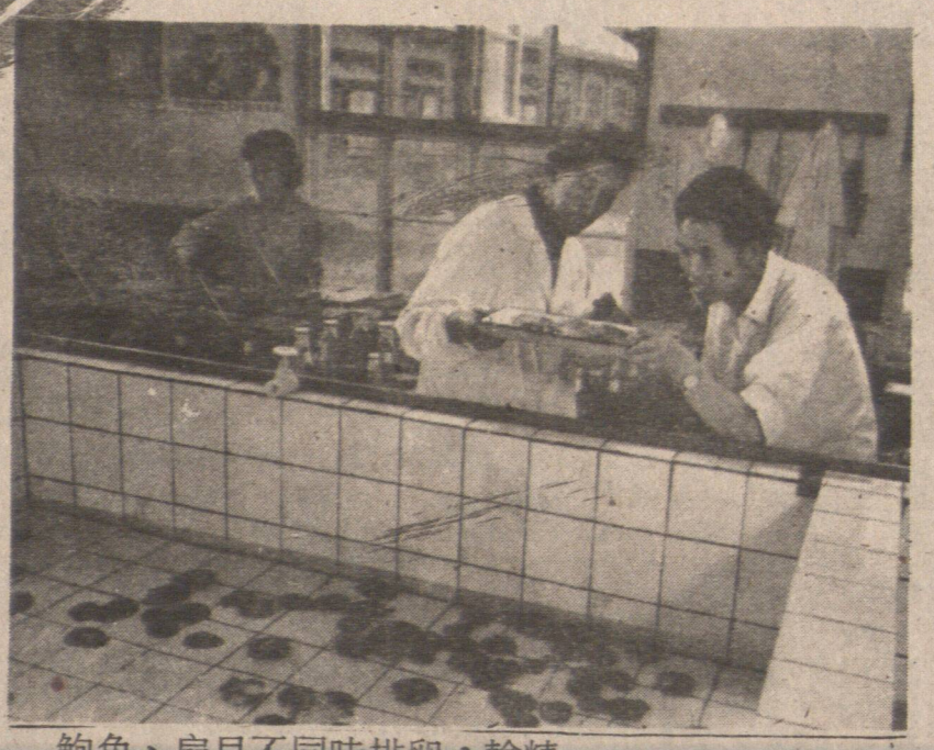
鮑魚、扇貝不同時排卵，輸精，很難人工育苗。這裡的水產科技人員試驗紫外線照射的辦法，成功地同時促使雌雄體排卵、輸精，這是把經過照射的扇貝，鮑魚分裝在容器內，觀察它們軟組織的蠕動變化。