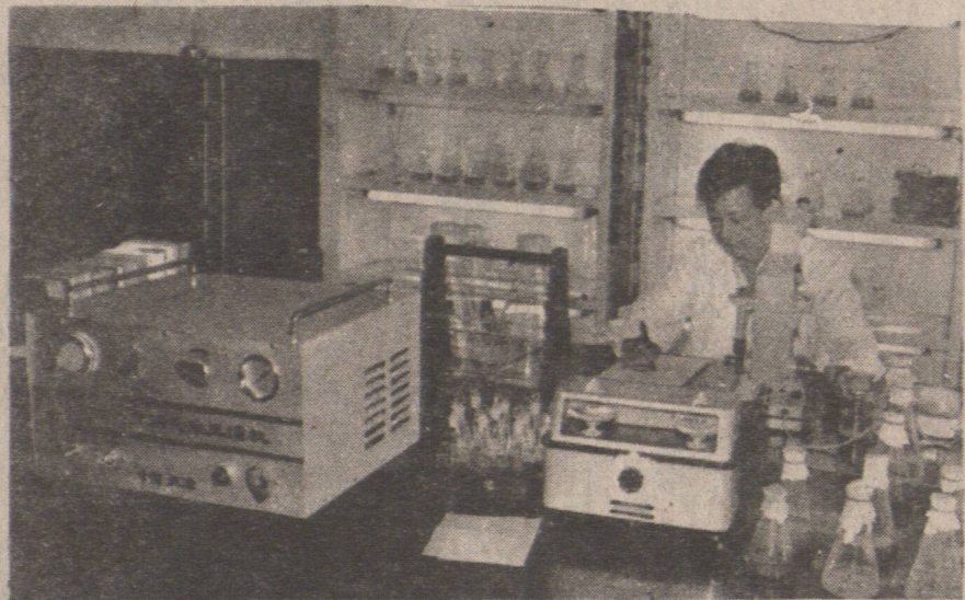
黃海水產研究所餌料組專家在進一步培育成本低的珍貴海產品餌料。