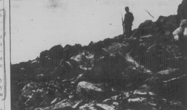
Карпатські гори в 1915 році встелені горами трупів.

Успіхи в індустріалізації СР СР, в колективізації сільського господарства, успіхи в культурно-національному будівництві, сила й міць Червоної армії — це те, що чимраз більше революціонує трудящі маси, пригноблених цілого світа. І на день боротьби проти загрози нової імперіалістичної війни робітничі, колгоспники, незатимки й середники радянської країни, бази світової пролетарської революції, пам'ятаючи слова Леніна, що нині СРСР свій вплив на світову пролетарську революцію значне господарським будівництвом, ще завятіше працюватимуть, реалізуючи плани розгорнутого соціалістичного наступу, що їх визначила Ленінова партія на XVI З'їзді ВКП(б), на XI З'їзді КП(б)У.