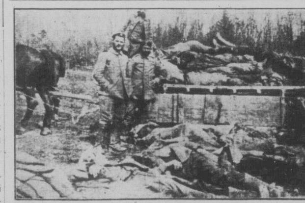
Складають на вози трупи замордованих на полі бою робітників.